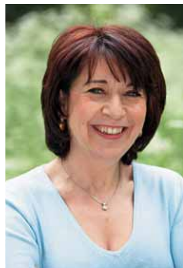
Nous inscrirons le développement durable au coeur des politiques publiques ...