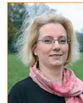
Nous choisirons l'éducation comme priorité nationale